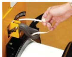
Mudança da bobine fácil