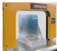
Batentes para um posicionamento preciso das embalagens