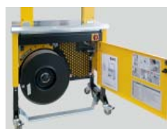
Forma compacta e robusta