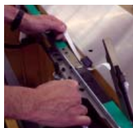
Manutenção sem ferramentas